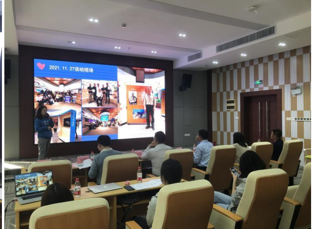
图 4：深圳海洋图鉴项目路演