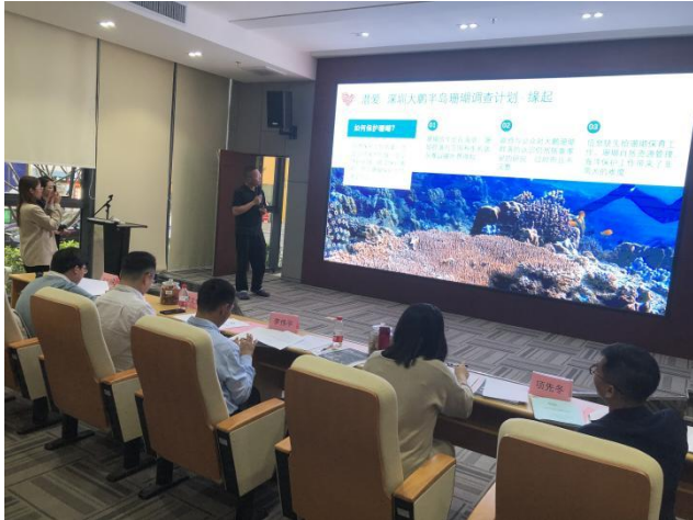
图 3：大鹏半岛珊瑚调查项目路演