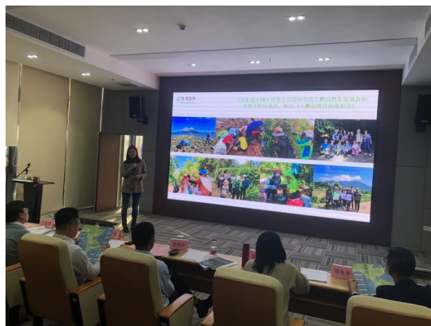
图 2：大鹏自然探索家项目路演