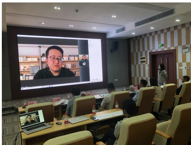
图 1：园林绿化废弃物在大鹏新区的资源化利用线上项目路演